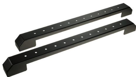
Zestaw nóżek VR-SOK-B